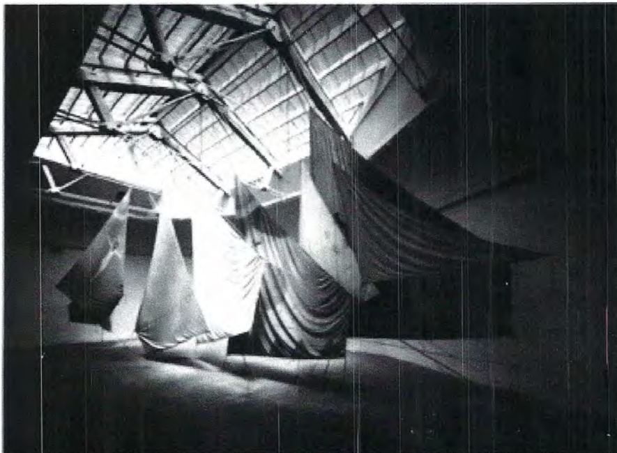
Jannis Kounellis ,Senza titolo, 1993, Biennale di Venezia (vele)